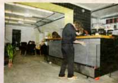
Coffice hyr ut kontorsplatser till frilansare.